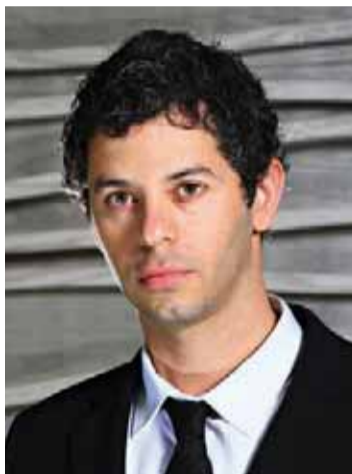
"הציפיה מהיילו שיתלונן אינה סבירה". עו"ד אייזנברג

"הציפיה מהיילו להתלונן אינה סבירה", אומר אייזנברג בתגובה. "היילו לא שיתף את המשפחה שלו ואת החבר הכי טוב שלו במעשה הסחיטה של ירון