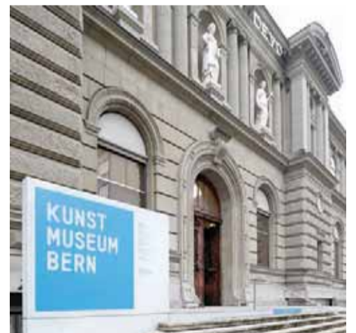
בני משפחתו של גורליט מסרבים לוותר בקלות על האוסף היקרתי. מוזיאון האמנות בברן