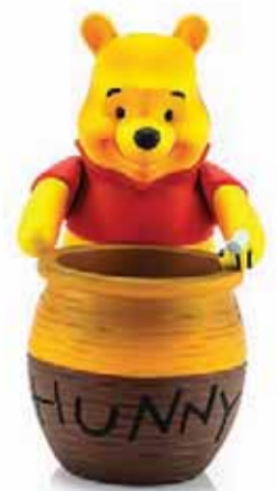
"מסתובב חשוף לחלוטין בפומבי". פו הדוב