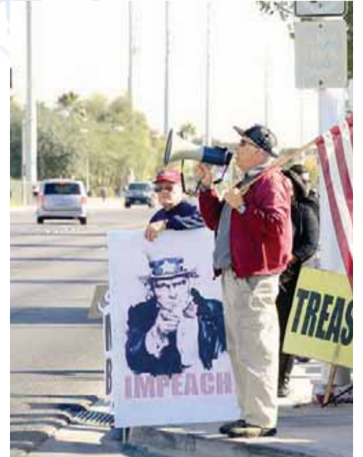
"התעלמות מדעת הקהל האמריקני". מפגינים נגד מדיניות אובמה. השבוע בלאס וגאס