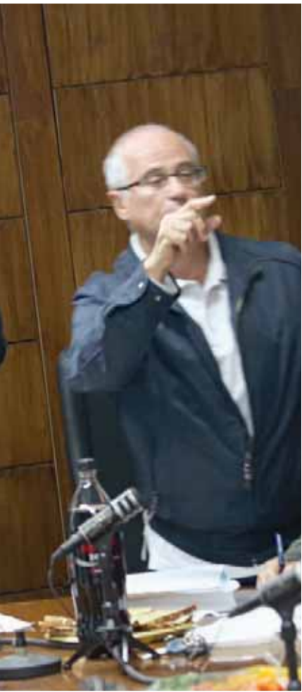
כיועץ המשפטי של המועצה המקומית תל-מונר, ייצג בעתירה את ראש המועצה מול חברי המועצה שגם אותם הוא אמר לייצג, בזמן שחברי המועצה מימנו את מאבקם המשפטי מכיסם.

הצעת חוק חדשה מבקשת להגביר את כוחם של חברי המועצה על חשבון ראשי הרשויות, ובכלל זאת להעניק להם תגמול כספי וייעוץ משפטי. השאלה היא למי יוגש החשבון