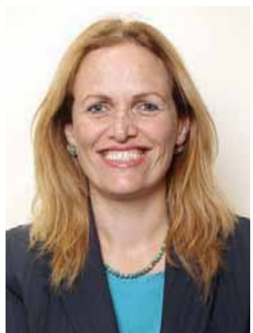
"לחברי המועצה אין כלים לפקח על ראשי הרשויות". ח"כ קריב