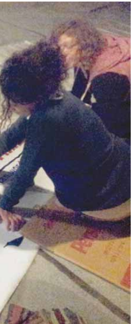
צדיקים בטרם נרצח, אינם מהווים הגנה (מלאה) במשפט, נכתב.

גם בעיקרי הטענות שהגישה לקראת הדיון בערעור חזרת הפרקליטות על עמדה זו, שלפיה היילו לא פעל מתוך הגנה עצמית ולא עמד בפני סכנה מוחשית. "תחושות אומללות, זעם, תסכול ורחמים עצמיים, וגם העובדה שהמנחה לא נמנה על ל"ו