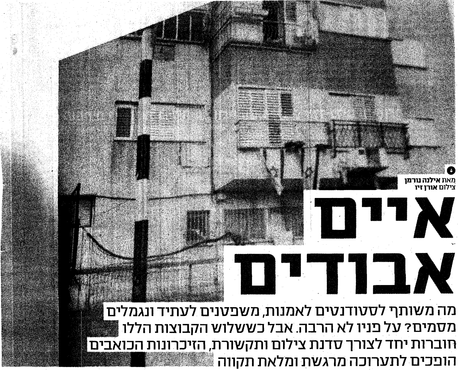
מאת אילנה נורמן